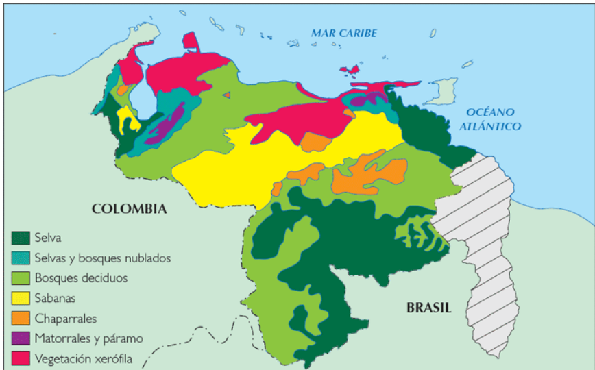
ベネズエラの植生分布

マングローブ林: レッドマングローブ ( Rhizophora mangle )、ホワイトマングローブ ( Laguncularia racemosa )、ブラックマングローブ ( Avicennia germinans )、ボタンマングローブ ( Conocarpus erectus ) 等